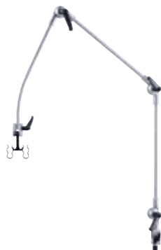
Gelenkarme mit Schlauchhalter MRT Art.Nr. G0500-MR