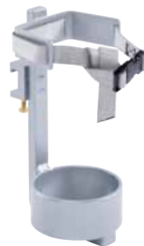
Flaschenhalterung MRT Art.Nr. 32MR0725MZ